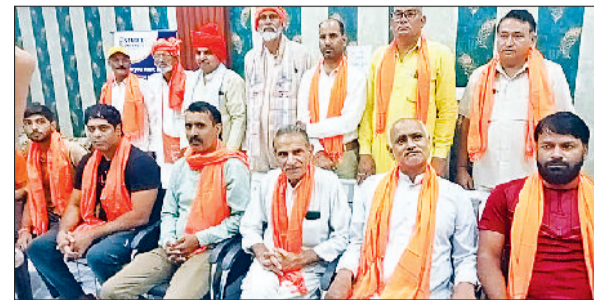
रेवाड़ी। सभा में मौजूद गोरक्षक सम्मान समिति के सदस्य।

गाड़ी संख्या 14322 मुज-बरेली रेलसेवा 12 जुलाई को मुज से प्रस्थान करके अपने निर्धारित मार्ग फुलेरा-जयपुर-रेवाड़ी के स्टेशन पर परिवर्तित मार्ग फुलेरा-रींगस-रेवाड़ी होकर संचालित होगी। परिवर्तित मार्ग में यह रेलसेवा रींगस, नीम का थाना, नारनोल व अटेली स्टेशनों पर ठहराव करेगी। गाड़ी संख्या 15014 काठगोदाम-जैसलमेर रेलसेवा 12 जुलाई को काठगोदाम से प्रस्थान करके अपने निर्धारित मार्ग रेवाड़ी-जयपुर-फुलेरा के स्टेशन पर परिवर्तित मार्ग रेवाड़ी-रींगस-रेवाड़ी होकर संचालित होगी। गाड़ी संख्या 14853 वाराणसी सिटी-जोधपुर रेलसेवा 12 जुलाई को वाराणसी से प्रस्थान करके अपने निर्धारित मार्ग भरतपुर-बांदीकुई-जयपुर के स्टेशन पर परिवर्तित मार्ग भरतपुर-सवाईमाधोपुर-जयपुर होकर संचालित होगी। गाड़ी संख्या 12403 प्रयागराज-लालगढ रेलसेवा 12 जुलाई को प्रयागराज से प्रस्थान करके अपने निर्धारित मार्ग आगरा कैंट-मथुरा-अलवर-जयपुर के स्टेशन पर परिवर्तित मार्ग आगरा कैंट-बयाना-सवाईमाधोपुर-जयपुर होकर संचालित होगी।