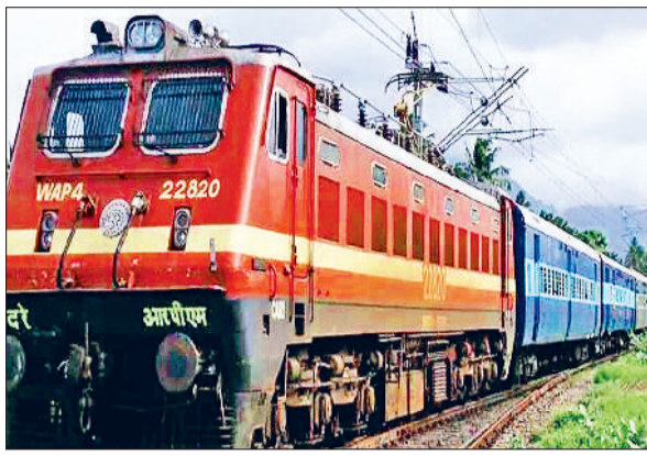
रेवाड़ी। रेवाड़ी रेलमार्ग से गुजरते हुए एक्सप्रेस ट्रेन।