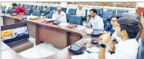
रेवाड़ी। अधिकारियों की बैठक लेते हुए डीसी अभिषेक मीणा।

डीसी अभिषेक मीणा ने प्रदेश के मुख्य निर्वाचन अधिकारी के साथ आयोजित वीडियो कॉन्फ्रेंस के बाद जानकारी देते हुए बताया कि जिले के बावल (अजा)72, कोसली-73 व रेवाड़ी-74 विधानसभा क्षेत्र में पोलिंग बूथों के रेशनेलाइजेशन का कार्य जारी है, जिन बूथों पर 12 सौ से अधिक