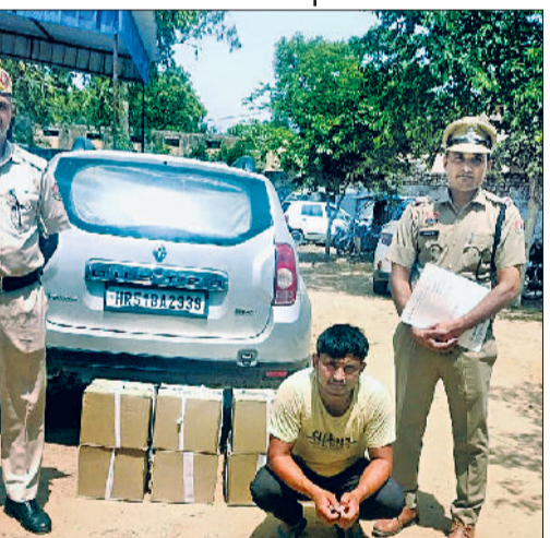
रेवाड़ी। पुलिस गिरफ्तार में शराब के साथ गिरफ्तार आरोपी।