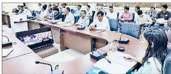
रेवाड़ी। समाधान शिविर की समीक्षात्मक बैठक में मौजूद एडीसी व अन्य अधिकारी।