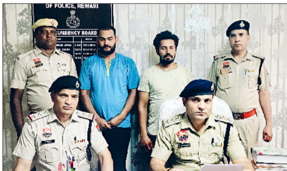
रेवाड़ी। पुलिस गिरफ्तार में हत्या के आरोपी व जानकारी देते डीएसपी।