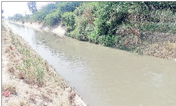
रेवाड़ी। दिल्ली रोड पर जेएलएन नहर में आया पानी, दिल्ली रोड स्थित स्टेशन से कालाका वाटर वर्क्स में जाता नहरी पानी।

दस जून को खूबड़ हेड से पानी छोड़ने के बाद वीरवार रात को जिले में नहर पहुंच गई है। शेड्यूल से तीन दिन लेट 27 दिन में जेएलएन नहर के पहुंचने पर शहरवासियों को गर्मी में पानी की किल्लत से राहत मिलने वाली है। नहर आने के बाद जनस्वास्थ्य विभाग की ओर से वाटर टैंकों में पानी स्टोरेज का कार्य शुरू कर दिया गया है। नहर पानी कम आने के कारण जिले में अप्रैल माह से ही पानी की किल्लत बनी हुई है। शहरवासियों को लंबे समय से राशनिंग करके पानी दिया जा रहा था। शहर में कालाका वाटर वर्क्स