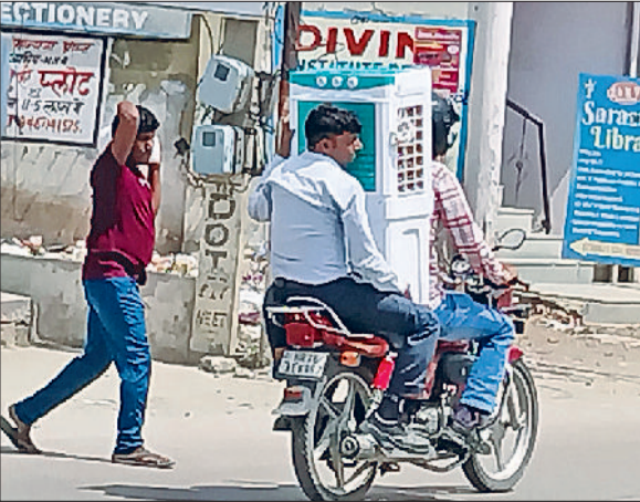
रेवाड़ी। गर्मी में राहत के लिए कूलर लेकर जाते हुए बाइक सवार।

आसमान में बादल छाने से बूंदबांदा की संभावना नजर आने लगी। शुक्रवार को सुबह से ही आसमान साफ रहा। तेज धूप के कारण सुबह 8 बजे के बाद से ही गर्म हवाएं चलनी शुरू हो गईं। अधिकतम तापमान 0.5 डिग्री सेल्सियस गिरकर 44.5 डिग्री पर आ गया। न्यूनतम तापमान 2.5 डिग्री सेल्सियस बढ़कर 26.5 डिग्री पर पहुंच गया। इससे रात के समय भी गर्मी ने लोगों की नींद हराम करना शुरू कर दिया है। हवा में नमी का स्तर 40 फीसदी तक रहने के कारण भारी गर्मी ने उमस पैदा कर दी, जिससे लोग शाम तक पसीने में तर-